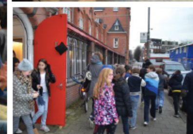
9. TERUG NAAR SCHOOL