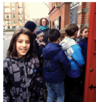
4. JAS OPHANGEN