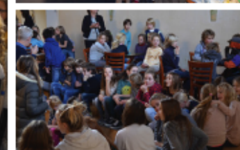
5. VERZAMELEN IN DE FOYER