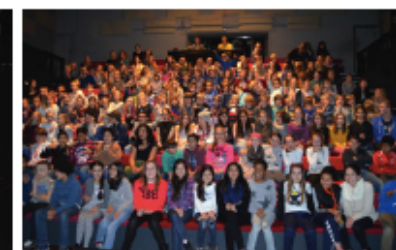
7. IEDEREEN ZIT ER KLAAR VOOR