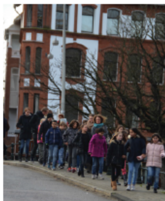
2. OP WEG NAAR DE KRAKELING OVER DE KOEKJESBRUG