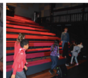
6. DE ZAAL IN